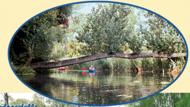
Anlagestelle Kanustation „Zur Alten Oder“

Post-Anschrift: Fahrrad- & Kajakverleih • AktivEvents Maik Gesche Marxwalder Straße 4 15306 Gusow-Platkow