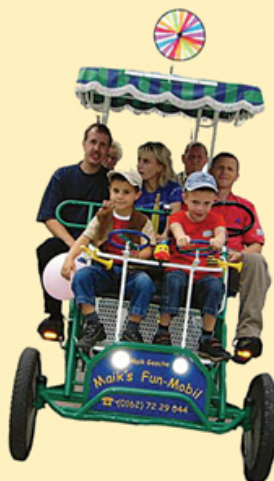
Stand Juni 2012 (Änderungen vorbehalten)

Unser spezielles Konferenzfahrrad können Sie für 2,00 €/h/Person mieten. Man kann es mit bis zu 6 Erwachsenen und 2 Kindern gleichzeitig fahren